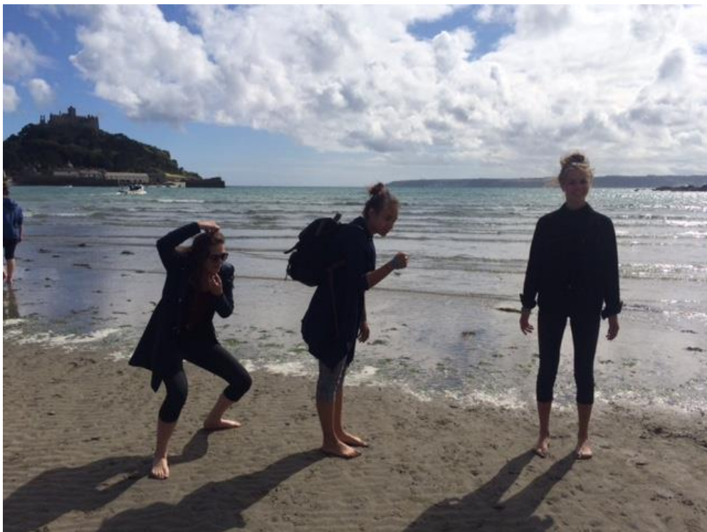
Darwinova evoluční teorie