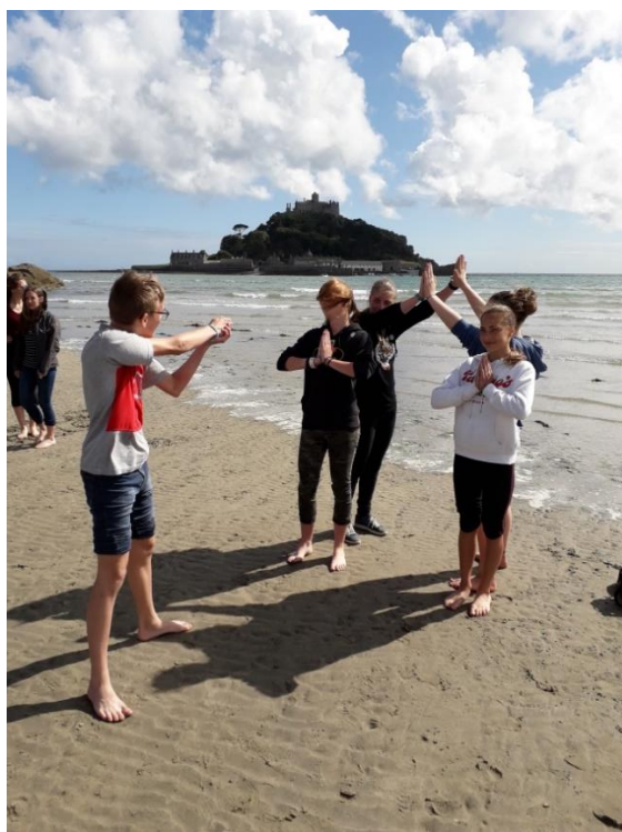
Stavba katedrály v Exeteru

Na pláži studenti dostali možnost představit zpracování svých úkolů, jejichž zadání si předtím v autobuse vylosovali. Téma se vždy nějak dotýkalo Velké Británie. Po počáteční mírné individuální nevoli se s tím popasovali skvěle, a jak vidíte na fotografiích, i s úsměvem. Níže aspoň některé z nich. Poznáte, jaká zadání zpracovali? :-)