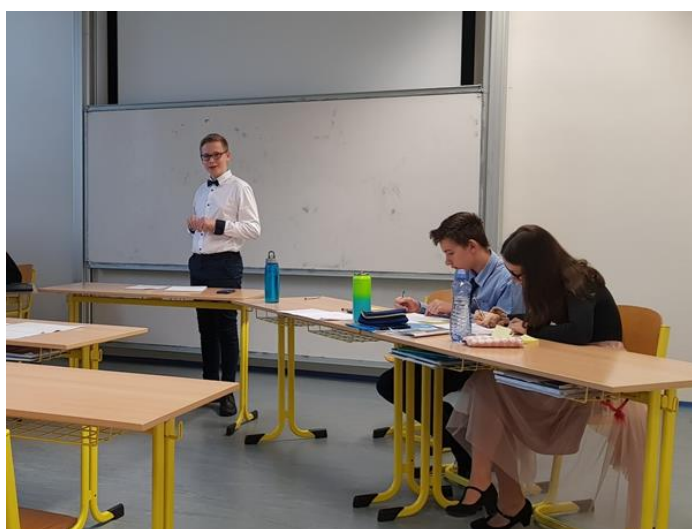
Ilustrační foto z dřívějšího turnaje.